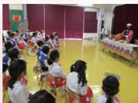
英語講師による英会話 【ハロウィンパーティー】