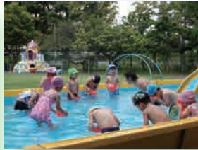
体育講師による体育活動